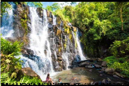
El Estero de las Animas, Managua, Nicaragua