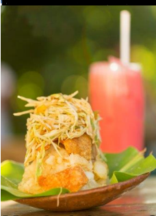
El Pasa, Managua, Nicaragua