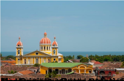
San Juan de los Rios, Managua, Nicaragua