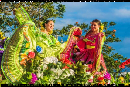
Costumbres de las mujeres de las zonas rurales de Nicaragua