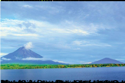
Volcán de la Cruz, Managua, Nicaragua